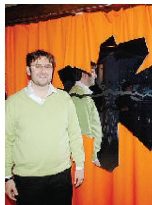
Gli specchi di «Glocal»