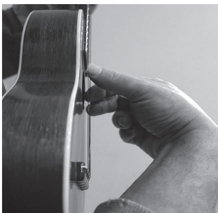
Posizione della mano e delle dita

Il contatto della parte laterale dei polpastrelli sulla lunga corda della chitarra può servire a un maggiore controllo del suono, sull'ukulele questo non funziona e il suono generale perde di precisione e corpo. La mano dovrebbe avere la posizione che puoi vedere nelle foto.