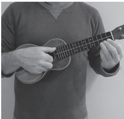
Come imbracciare lo strumento (in piedi)

Nelle seguenti immagini viene mostrato come imbracciare l'ukulele sia in posizione seduta che in piedi.