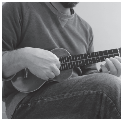
Come imbracciare lo strumento (seduti)