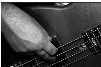
POSIZIONE DELLA MANO DESTRA (DA DAVANTI)