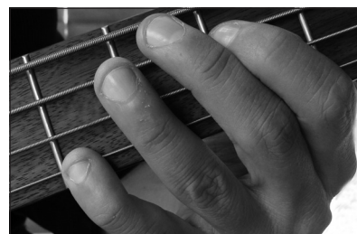
POSIZIONE DELLA MANO SINISTRA

Nella seconda metà del brano, si inserisce un assolo di chitarra elettrica: in un brano è importantissimo saper accompagnare un cantato così come uno strumento solista. Questo ti aiuterà a mantenere la concentrazione sulla batteria, a prescindere dal contesto.